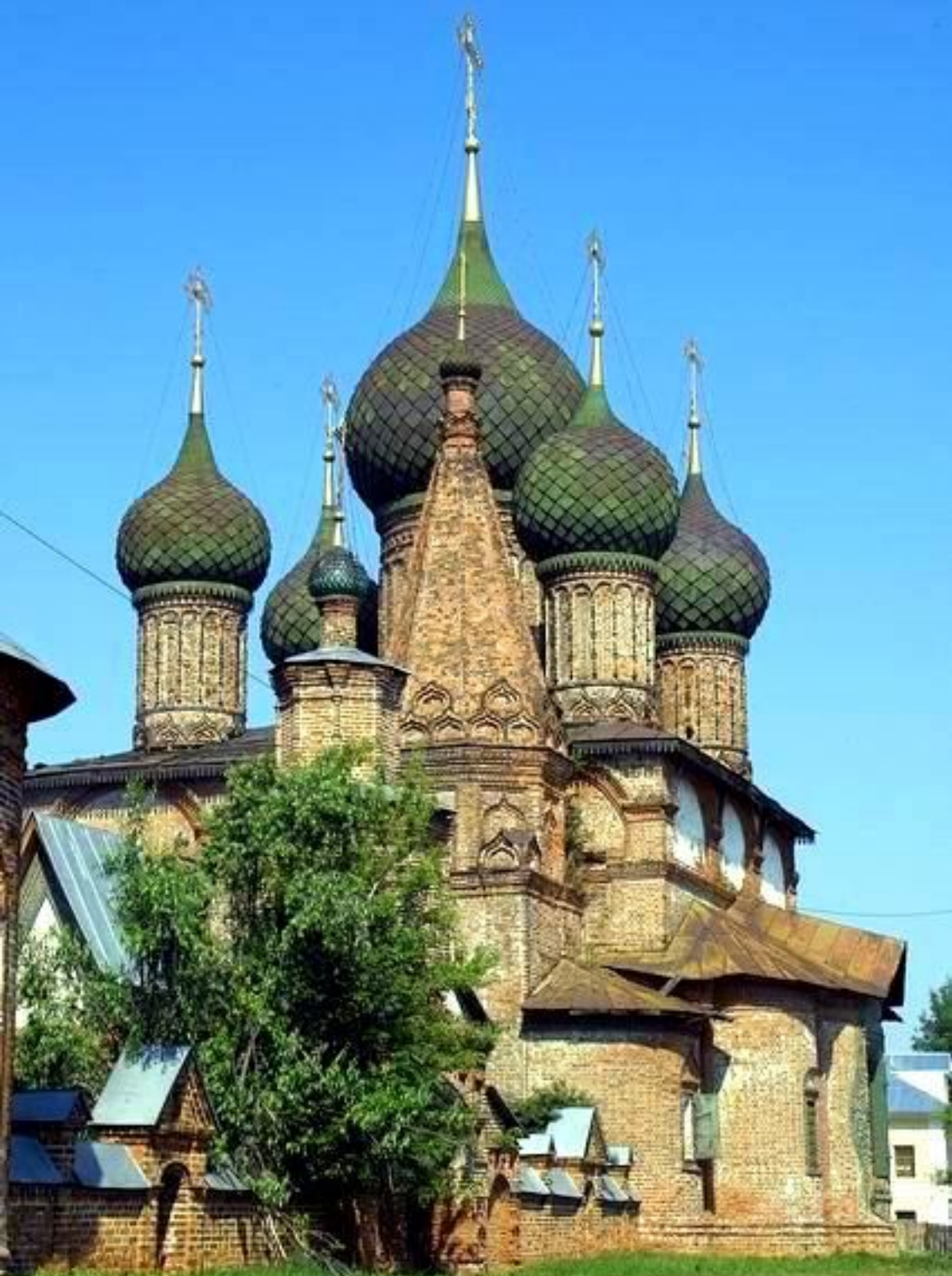
Церковь Святителя Иоанна Златоуста в Коровниках.