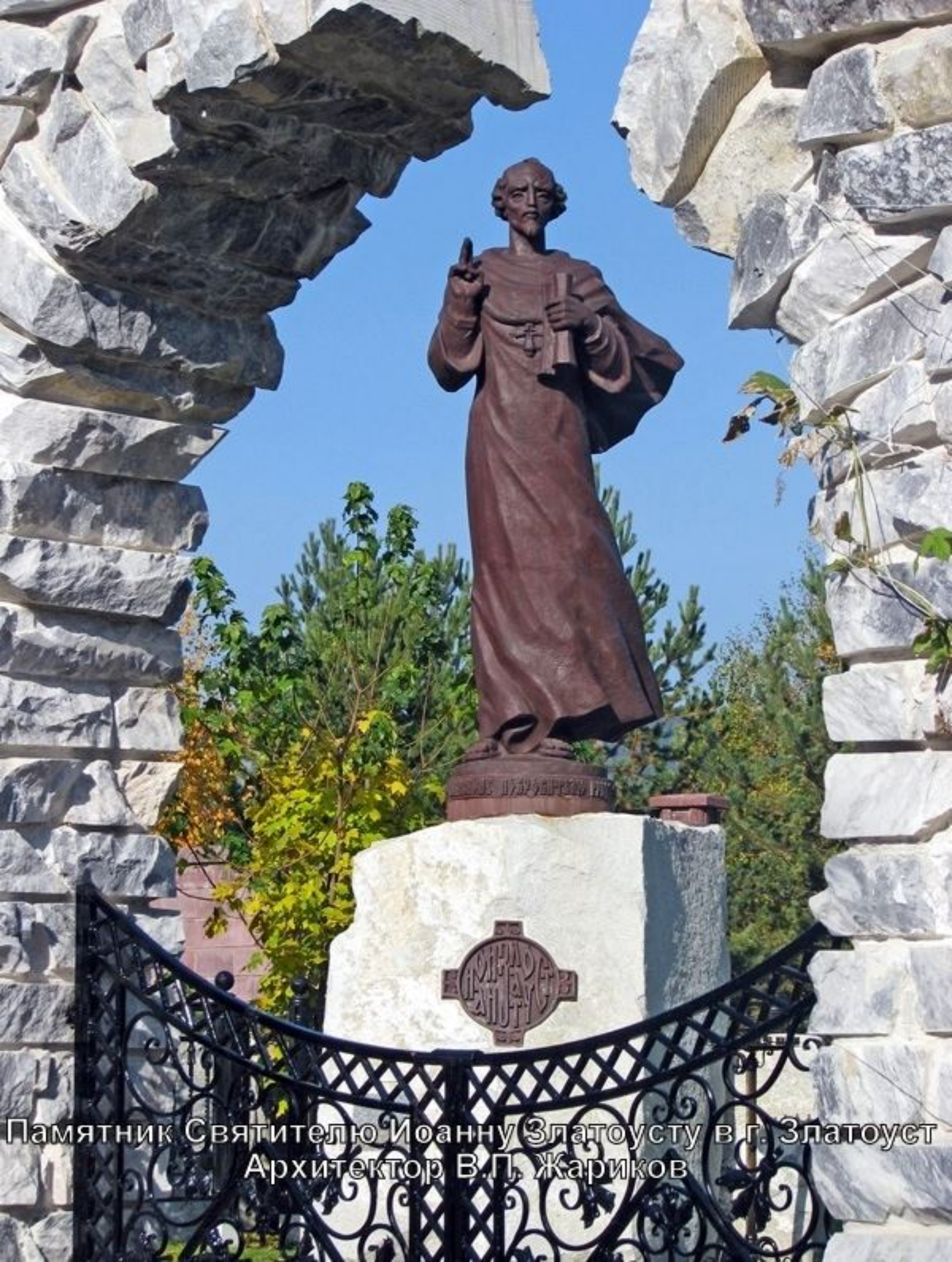
Памятник Святителю Иоанну Златоусту в г. Златоуст Архитектор В. П. Жариков