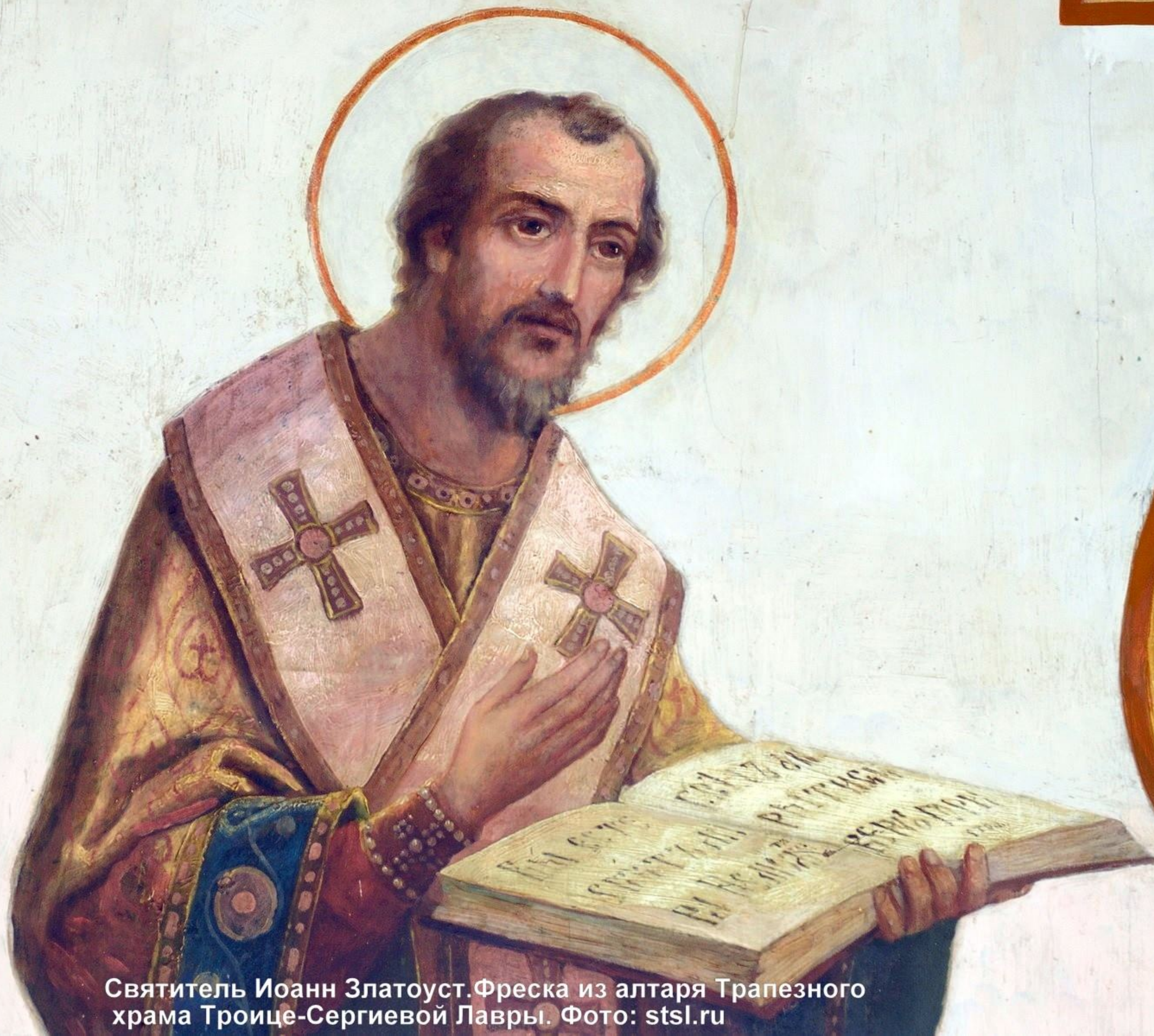
Святитель Иоанн Златоуст. Фреска из алтаря Трапезного храма Троице-Сергиевой Лавры.