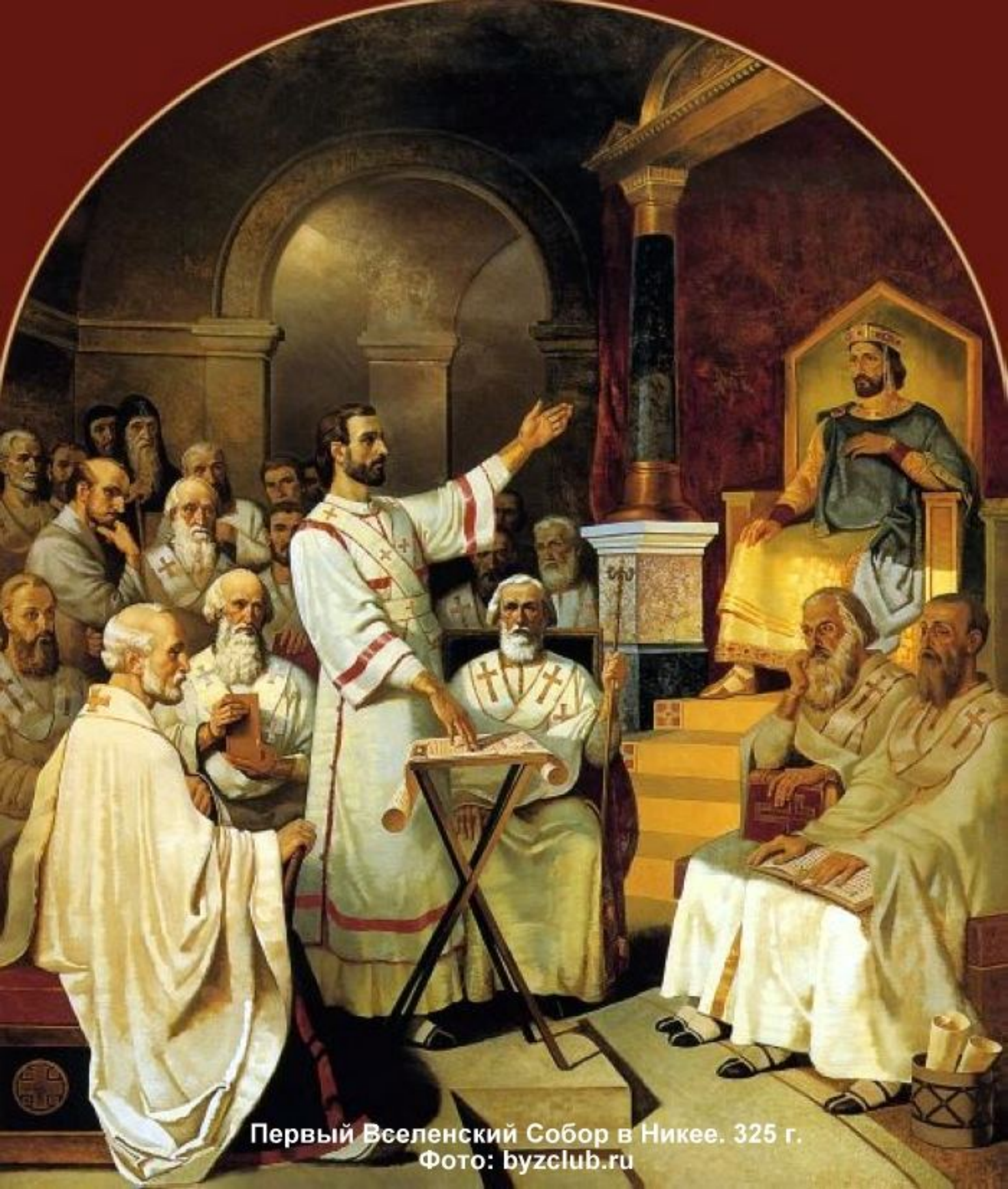
Первый Вселенский Собор в Никее. 325 г.