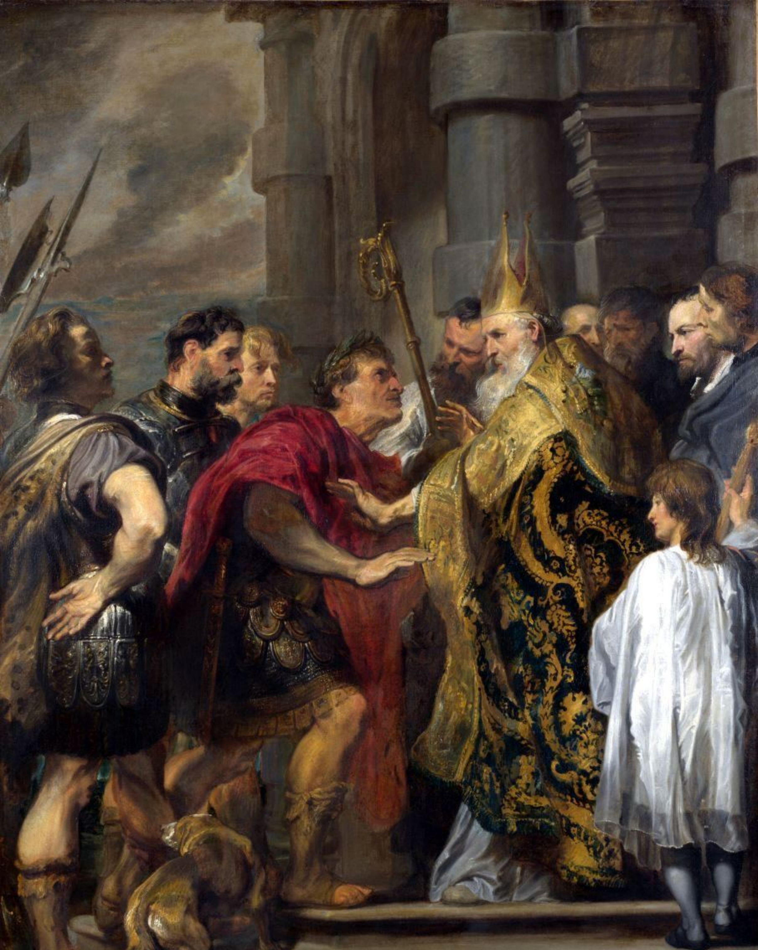
Святой Амброзий останавливает императора Феодосия у входа в Миланский собор. Художник А. ван Дейк.