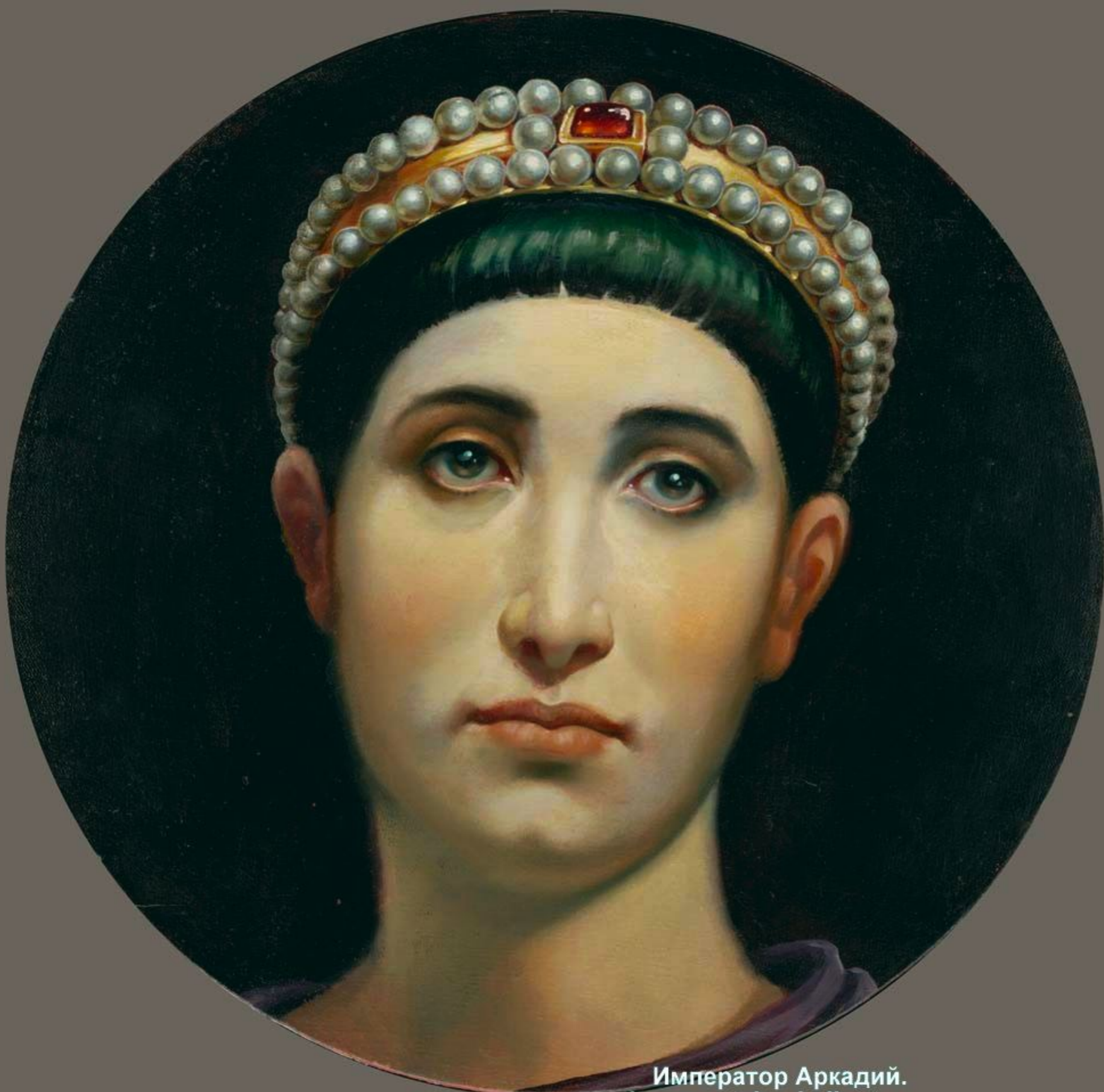
Император Аркадий. Фото: antoine-helbert.com