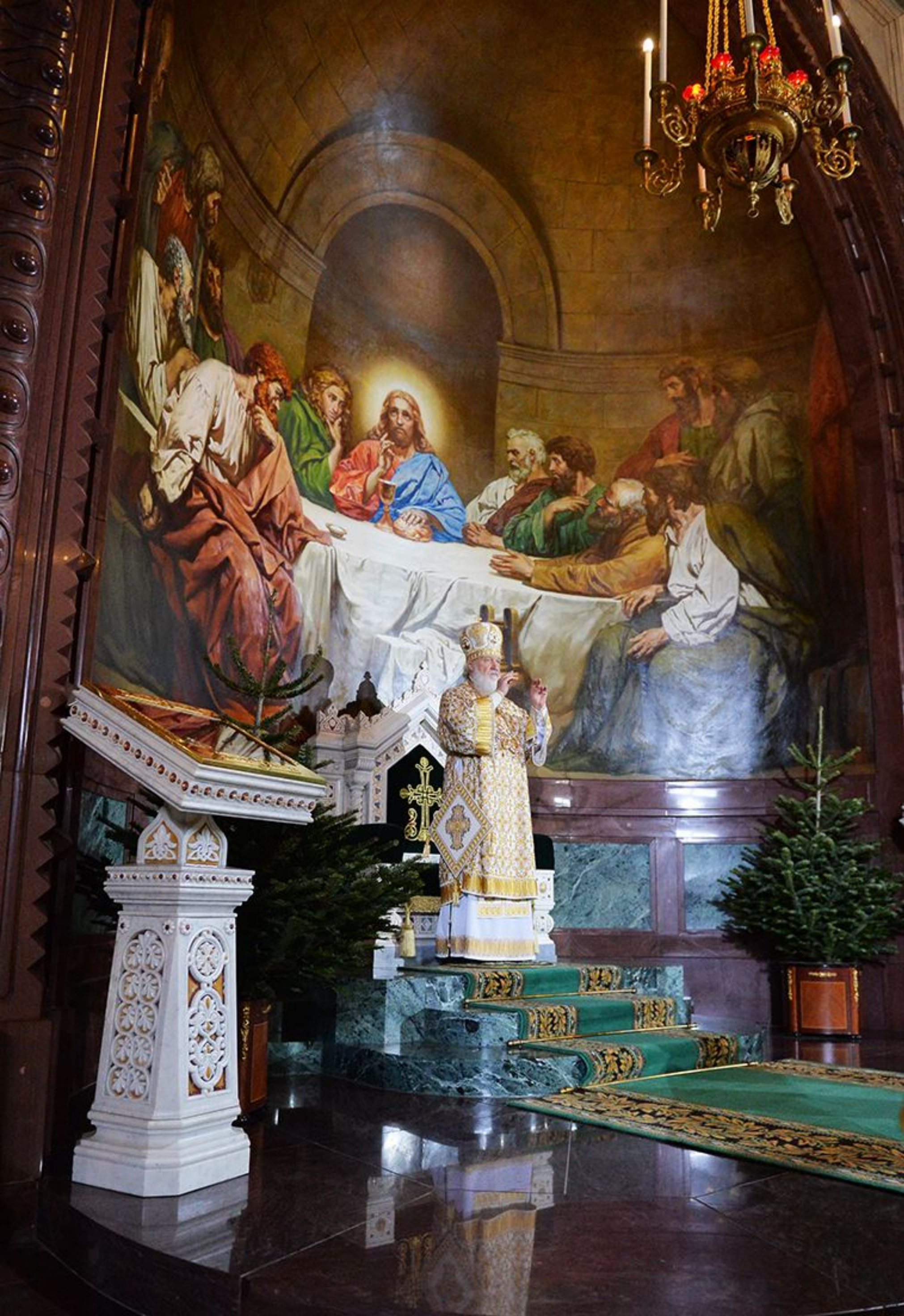
Патриаршее богослужение в праздник Рождества Христова в Храме Христа Спасителя 7 января 2017 г.