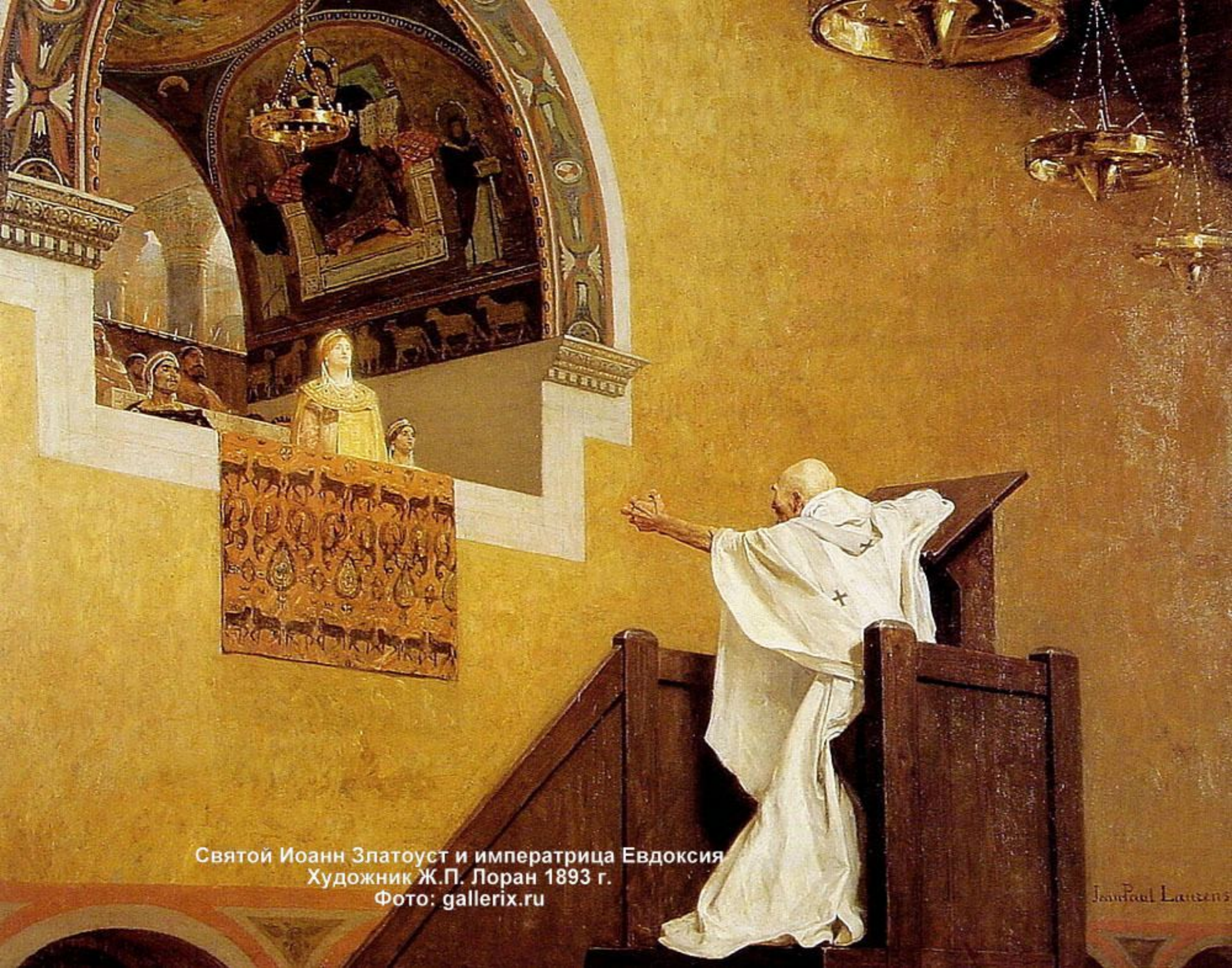
Святой Иоанн Златоуст и императрица Евдокия Художник Ж.П. Лоран 1893 г.